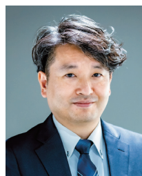
VIEWnext 編集部 統括責任者

福井県の公立高校に国語科教諭として勤務後、福井県教育庁課長（学力向上）、福井県立若狭高校校長、福井県教育庁学校教育監等を歴任。若狭東高校勤務時は、若狭地区の県立高校再編整備にも携わった。現在、独立行政法人教職員支援機構のフェロー（学び合う教師コミュニティの形成支援）も務める。