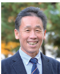
福井大学連合教職大学院 教授 独立行政法人教職員支援機構 フェロー